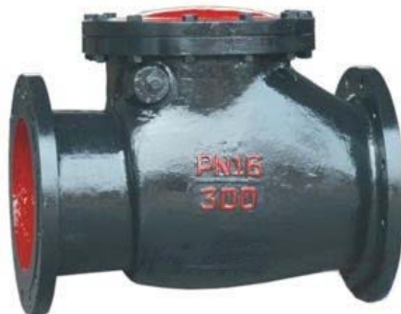
H44 铸铁旋启式止回阀