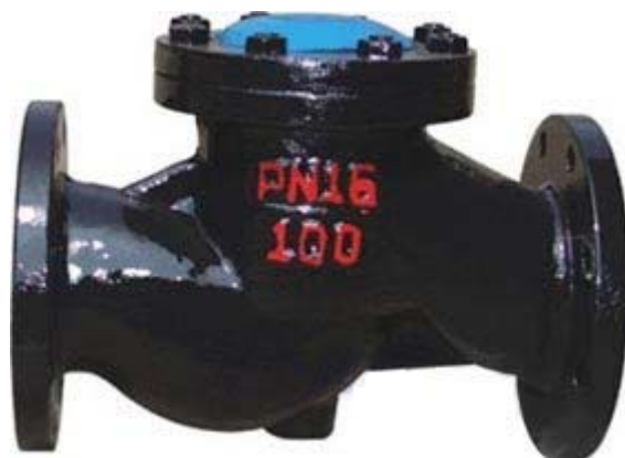
H41 铸铁升降式止回阀